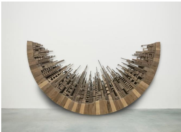
『コンポーザー（平穏）』

一点ものとなるこれらの作品にはジェームス・マクナブの署名が入っており、品質証明書が付属しています。